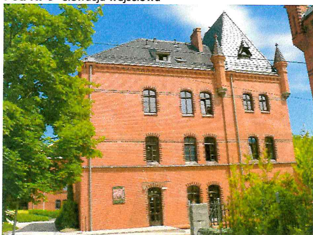
Fot. Nr 5- widok obiektu od strony południowej