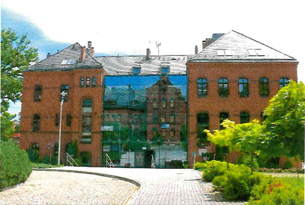
Fot. Nr 3- elewacja wejściowa