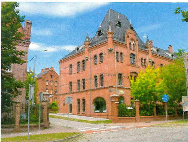
Fot. Nr 1- widok z ulicy dąbrowskiego