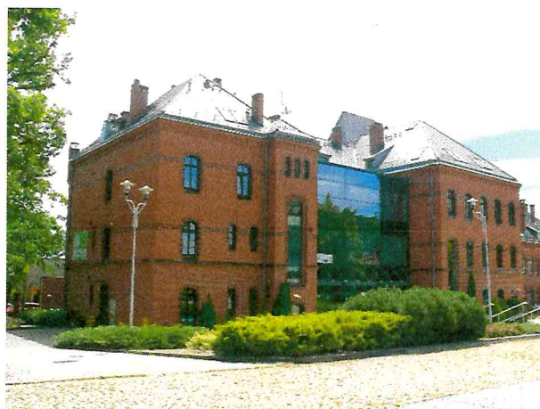
Fot. Nr 2 – widok obiektu od strony północnej